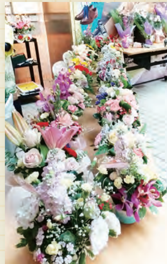
禮堂崇拜插花組於5月13及14日在交誼坊預備了花籃，讓會眾選購送給摯愛的母親。所有收入撥入教會經常費，名額100個。另聯絡委員會送給母親的禮物是杯墊。