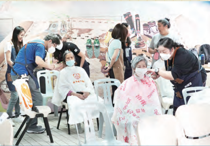
教會於4月15日（周六）為長者義務剪頭髮，有50多位義工參與工作，69位街坊長者參加，當中有4人決志信主。感謝神！