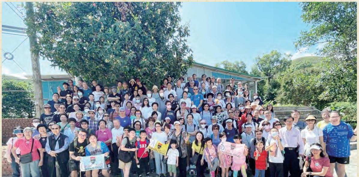
由聯絡委員會主辦，一年一度的教會旅行，於5月26日（周五）舉行。暢遊元朗香港濕地公園、火龍果山莊、品嚐農家菜。有160多人報名參加。