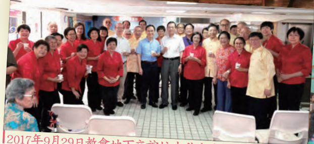
2017年9月29日教會地下交誼坊中秋音樂會