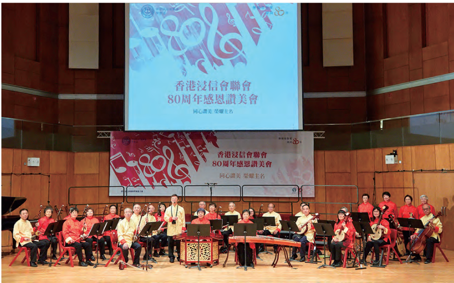
2018年11月3日參與香港浸信會聯會80周年感恩讚美會