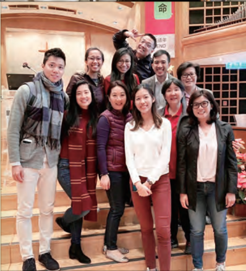
Christmas Service & Baptism 聖誕崇拜及浸禮

the worst days of our lives, that was when my husband left us (me and my 3 children), and when my house was burnt, I still see His blessings.