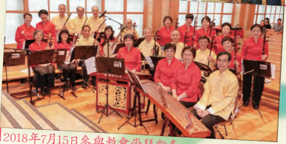
2018年7月15日參與教會崇拜獻奏

牧者蜜語 2020 Too Old! Too Old? 分享篇 一個真正的門徒 彩虹中樂團十周年紀念專輯 2019 夫婦日營 英語事工分享——信實的主 佳美腳踪 上帝的聲音 vs 人的聲音 基址連線 大 Guide 小景——赤浸剪影 文字事工委員會書籍介紹