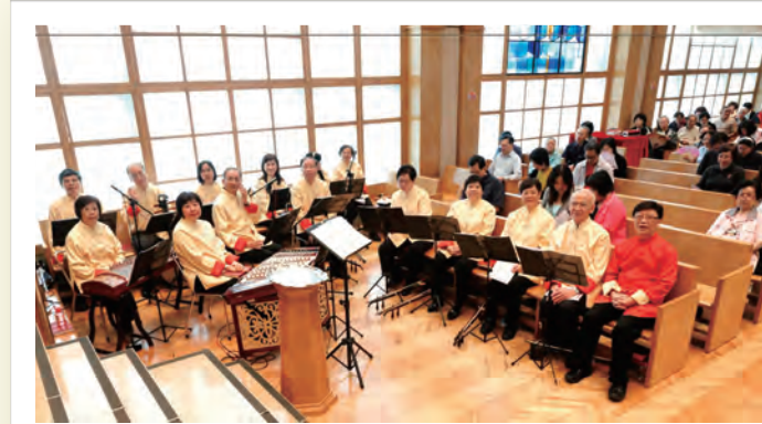
2012年11月11日金色年華長者慶典獻奏

我在樂團深深體會老師盡心及毫無保留的指導與心得分享，更有同學間的互相勉勵。令我認識到本身的不足，從而反思勤練去面對困難。當全團合奏，我更體會