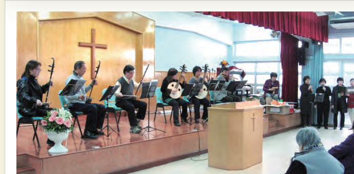
2010年12月8日探訪廣蔭護老院