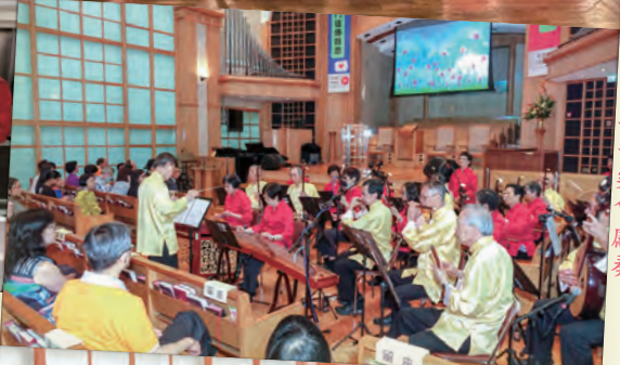
2018年5月5日教會婦女部百周年音樂會獻奏