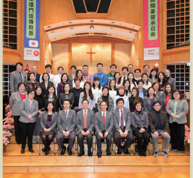
本會浸禮見證聚會於2019年12月25日(周三)下午2:00在一樓禮堂舉行,有25人受浸加入教會,4人轉會,由楊柏滿牧師施浸。