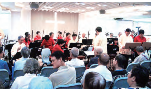
2017年6月15日好鄰舍福音堂彩虹中樂佈道會