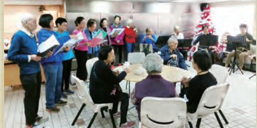
祝福鄰舍「義務剪髮為長者」服務於2020年1月11日(周六)上午9:30至11:30在本會地下停車場舉行，服務對象是長者街坊，並薄具茶點招待。