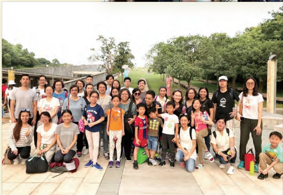
Outing to Wetland Park 參觀濕地公園