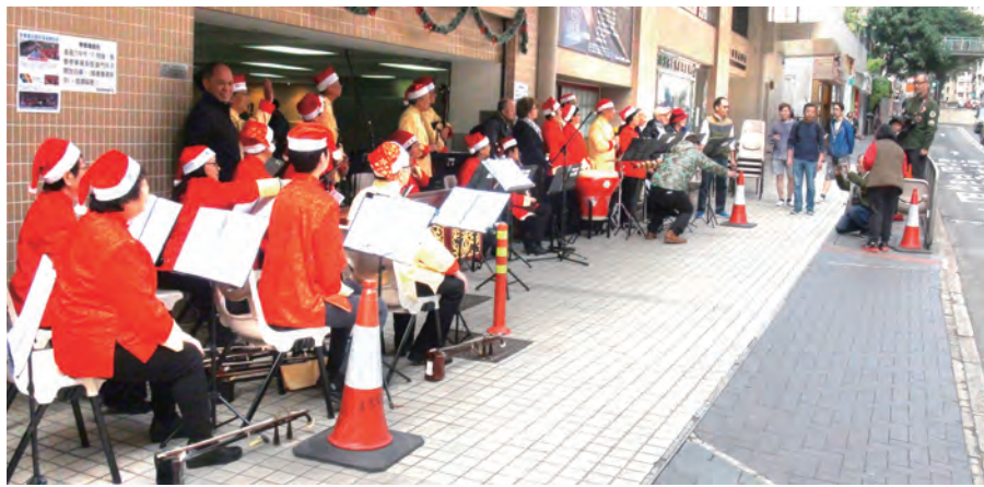
2017年12月22日教會地下交誼坊報佳音

「無盡感恩歸我父我神，無盡感恩獻給我主……」十年前在教會服務中心的帶動下開辦了一中樂學習班，一群已退休的會友，有機會學習彈奏中國樂