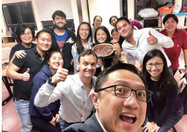
Connect Group celebrates Thanksgiving 小組組員慶祝感恩節

And yes, I chose to go home without the assurance of what would be my source of income when I'm already there because of the love for my family. But in my heart, I know that God will provide. Because even in