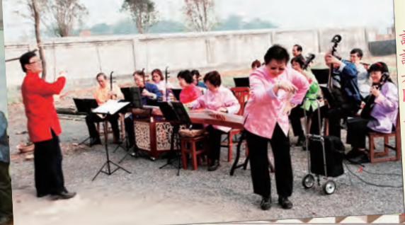
2011年3月31日英德探訪護老院戶外獻奏