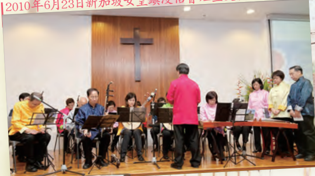
2010年6月23日新加坡女皇鎮浸信會短宣交流獻奏

香港浸信教會家訊 關心教會・溝通會友・探索生命 2020年3月1日・第41卷第1期